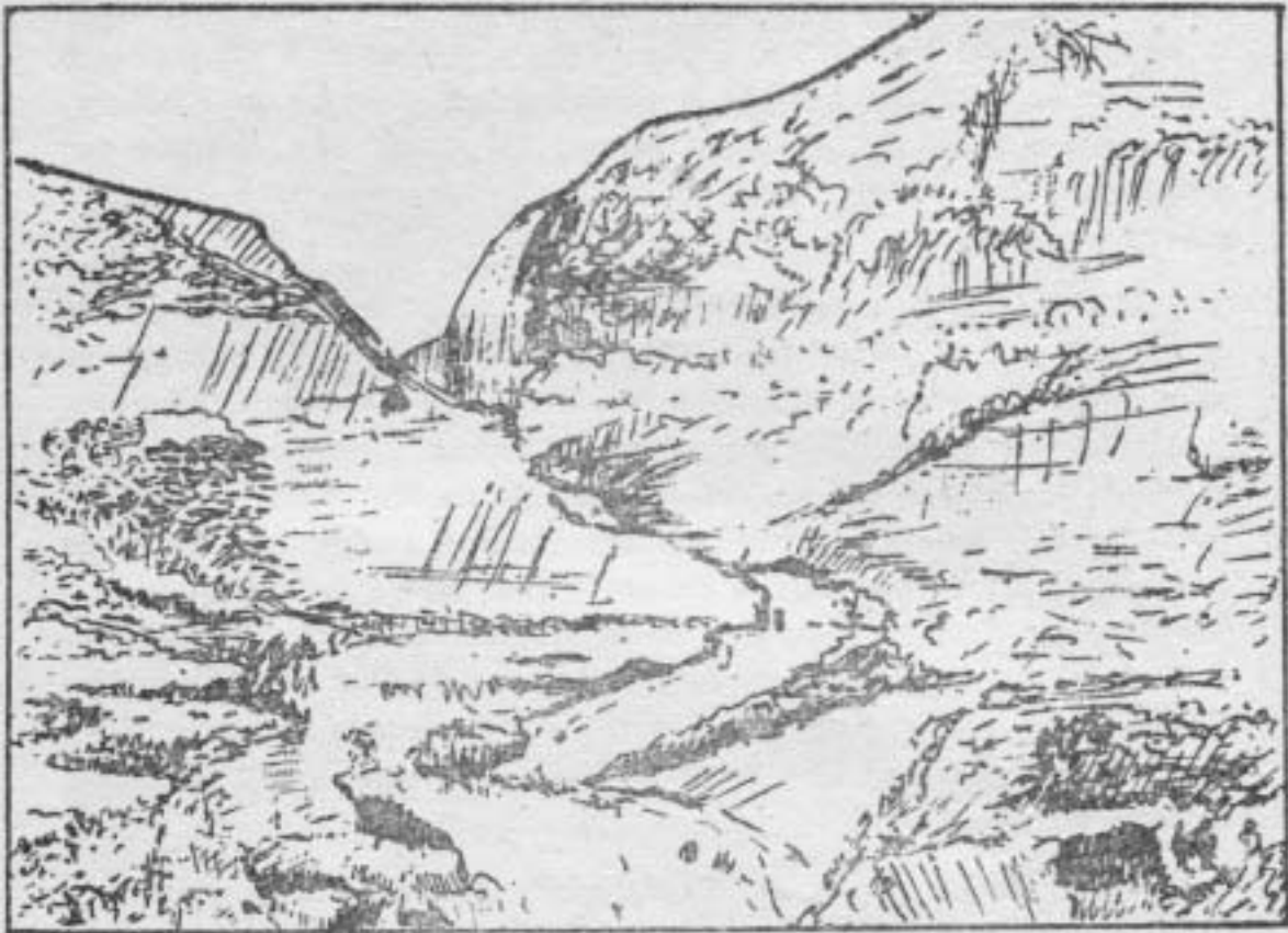
FIGURA 3 - Dibujo a pluma por H. Heink, de la Laguna de Guatavita desecada, según uno (fotografía de Beissmanger de 1910).

boquete o corte profundo por la parte norte atestigua el afán del buscador de tesoros por desaguarla.