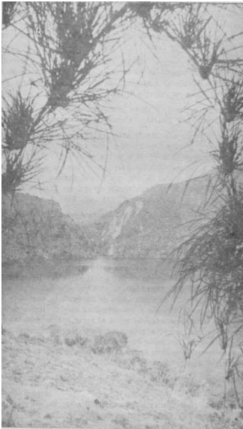
FIGURA. 2 - Laguna de Guatavita. En el borde del fondo se aprecia el corte hecho en diversos tiempos por los buscadores de tesoros en un esfuerzo por desaguarlo.

cantidad de oro, que solo el Cacique del pueblo de Simijaca echó en esta laguna cuarenta cargas que llevaron cuarenta indios desde el pueblo a la laguna", (11 pág , 248).