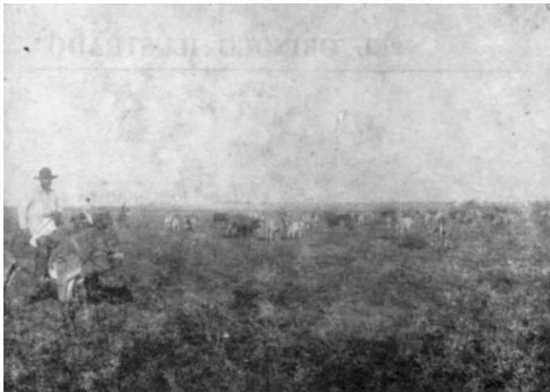
RIO META EN EL ATO DE YACUANA

A él se debe el florecimiento de las reducciones de los llanos y el entable de las del Orinoco, que, según carta del Padre General Tirso González, hasta entonces no habían sido sino degolladero de los operarios apostólicos, por los ataques de los caribes: a fuerza de fatigas en las entradas de habilidad en manejar a los bárbaros, de aguante en sufrir sus impertinencias de niños malcriados y de valor en encararse con su furia voltaria, fue sacando del bosque hoy una tribu, mañana otra y