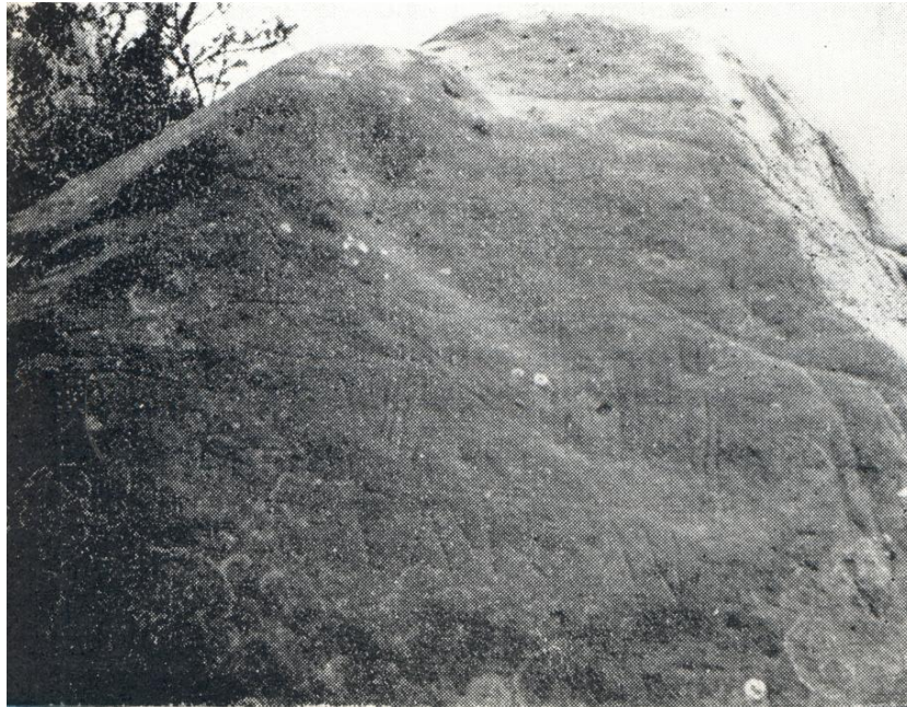
Letreros en el camino viejo.