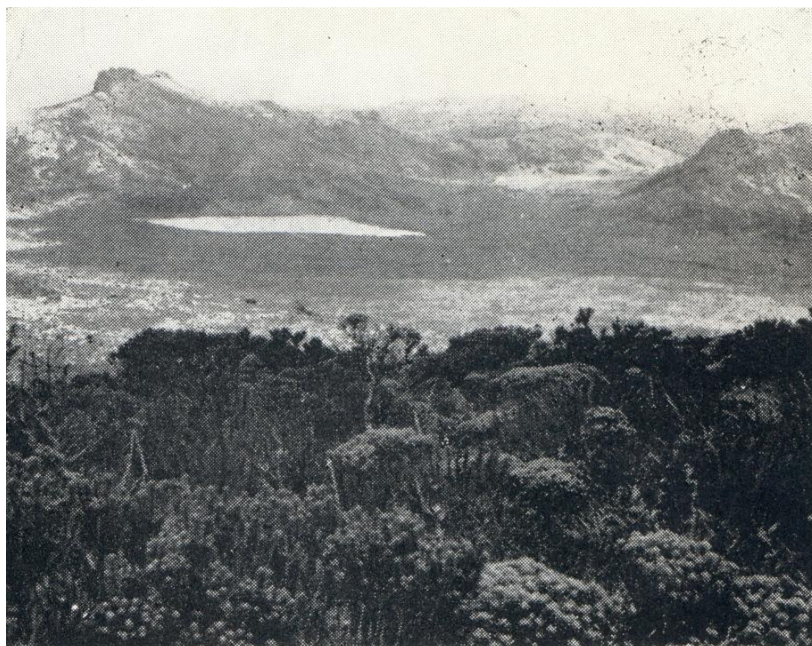
Laguna de la Magdalena al pie del cerro de las Tres Tulpas y aspecto de la vegetación en el filo de la montaña.

El camino en la actualidad está en malas condiciones, a pesar de ser un camino nacional y ser muy transitado por el ganado vacuno y los contrabandistas de coca que van del Departamento del Cauca al del Huila, así como también por las bestias de carga y silla que van del Departamento del Huila a los del Cauca y Nariño.